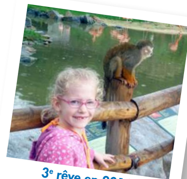
3 e rêve en 2016 Découverte des animaux à Planète Sauvage