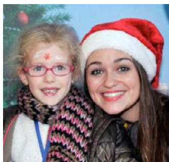
2 e rêve en 2015 Rencontre du Père Noël à bord d'un avion