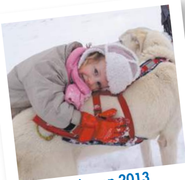
1 er rêve en 2013 Village du Père Noël dans le Haut-Jura